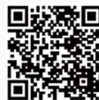
CEF 可獲發還款項課程 搜尋器

答: 由學生資助處管理的免入息審查貸款計劃下發放的貸款, 如用作支付 CEF 課程的學費, 而申請人又符合其他所有申請準則, 則仍符合資格獲發還有關費用。然而, CEF 下發還的款項會先用作償還申請人在免入息審查貸款計劃下獲發放用以支付同一課程學費的貸款。扣除免入息審查貸款計劃下的貸款後, 如仍有餘額, 有關的款項將存入申請人指定的銀行帳戶。