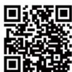
勞工處互動就業服務網頁 提供聯結往資歷架構網頁