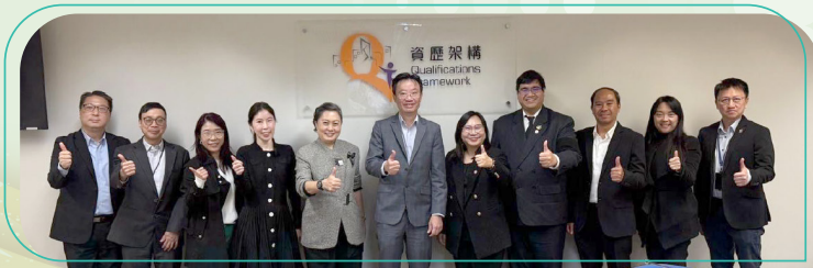
TPQI 到訪QF 秘書處。

泰國資歷架構當局Thailand Professional Qualification Institute (TPQI) 於11月20日到訪QF秘書處，互相交流以了解兩地資歷架構之最新發展及商討合作項目。