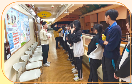
胡忠長者地區中心